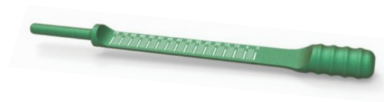
060 015 29 Mecha diam 1.1 x 20 mm fresa