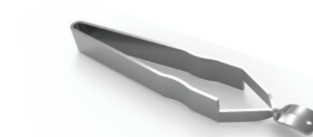
309 108 06 Levanta tornillo para Bk2